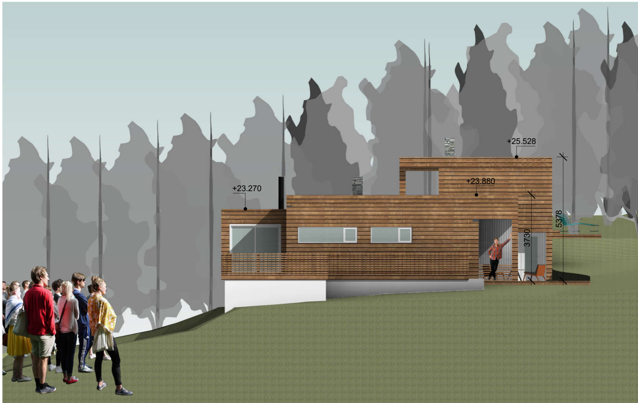
VEST Ny Situasjon 1 : 100