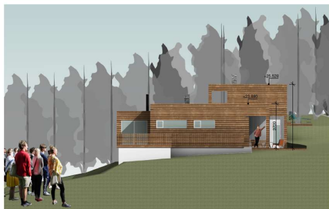
Fasade mot øst – iht gitt tillatelse