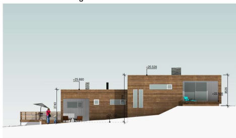
Fasade mot øst – iht gitt tillatelse