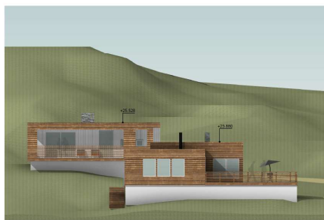
Fasade mot nord – justering i forbindelse med gjennomføringsfasen