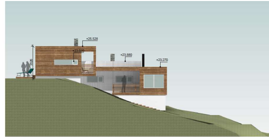
Fasade mot øst – justering i forbindelse med gjennomføringsfasen

Vedlagt følger oppdatert Gjennomføringsplan. Tiltakshaver har mottatt tilstrekkelig FDV dokumentasjon.