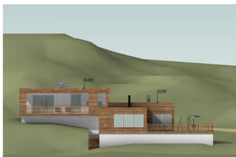
Fasade mot nord – iht gitt tillatelse

Vedlagt følger nye fasadetegninger da det er fortatt små justeringer av fasaden. I gjennomføringsfasen er det blitt gjort noen mindre justeringer av fasadene. Noen vinduer er fjernet (østfasaden), noen er blitt speilvendt, eller flyttet litt på i fasaden. Ingen vindusåpninger er blitt større enn rammesøkt. Vi mener at justeringene er av en slik omfang at de ikke utløser krav om endringssøknad eller at justeringene må nabovarsles. Under har vi sammenstilt rammesøknadstegningene opp mot FDV-tegningene.