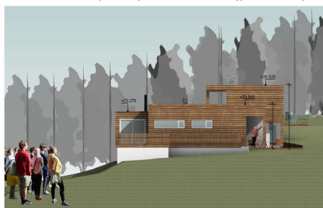
Fasade mot øst – justering i forbindelse med gjennomføringsfasen