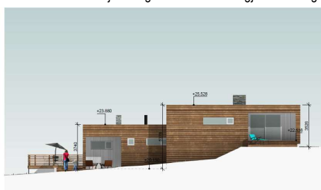
Fasade mot øst – justering i forbindelse med gjennomføringsfasen