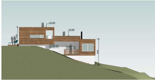
Fasade mot øst – iht gitt tillatelse