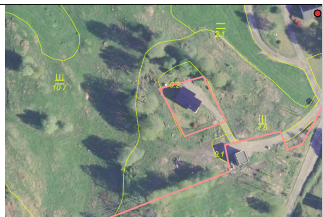
Flyfoto med markslag