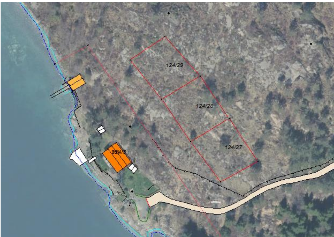
Figur 2 Ortofoto