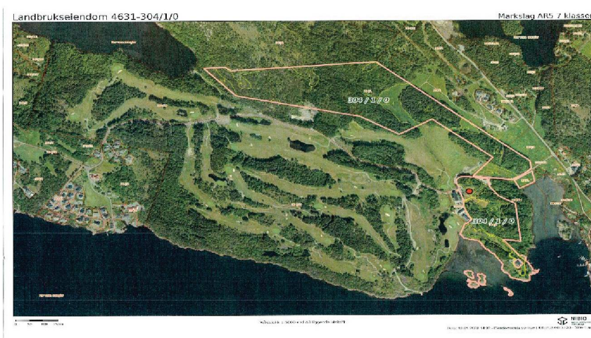
Satelittbilde som viser grensen til gnr 304, bnr 1.