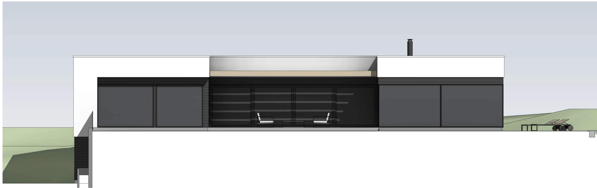
sørøst 1 : 100