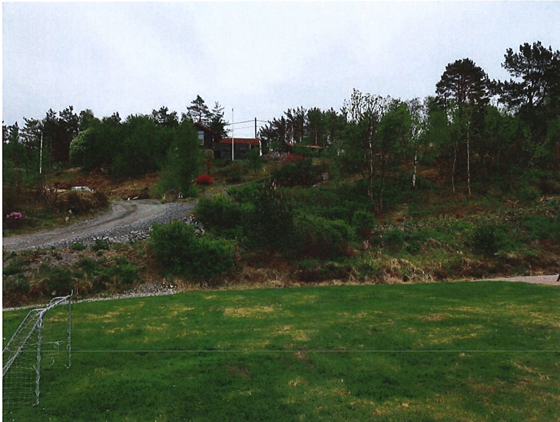
Figur 3: Eksempel på skråningene over tomtene. Bildet er tatt midt på 214/99, retning øst. En ser at det er et tynt løsmassedecke og at terrenget for det meste er relativt slakt og godt bevokst av middels høy blandingsskog.