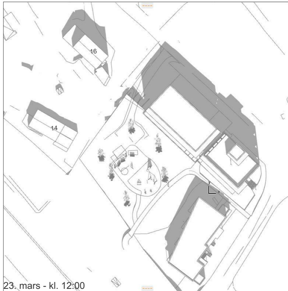
23. mars - kl. 12:00