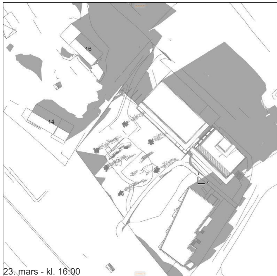
23. mars - kl. 16:00