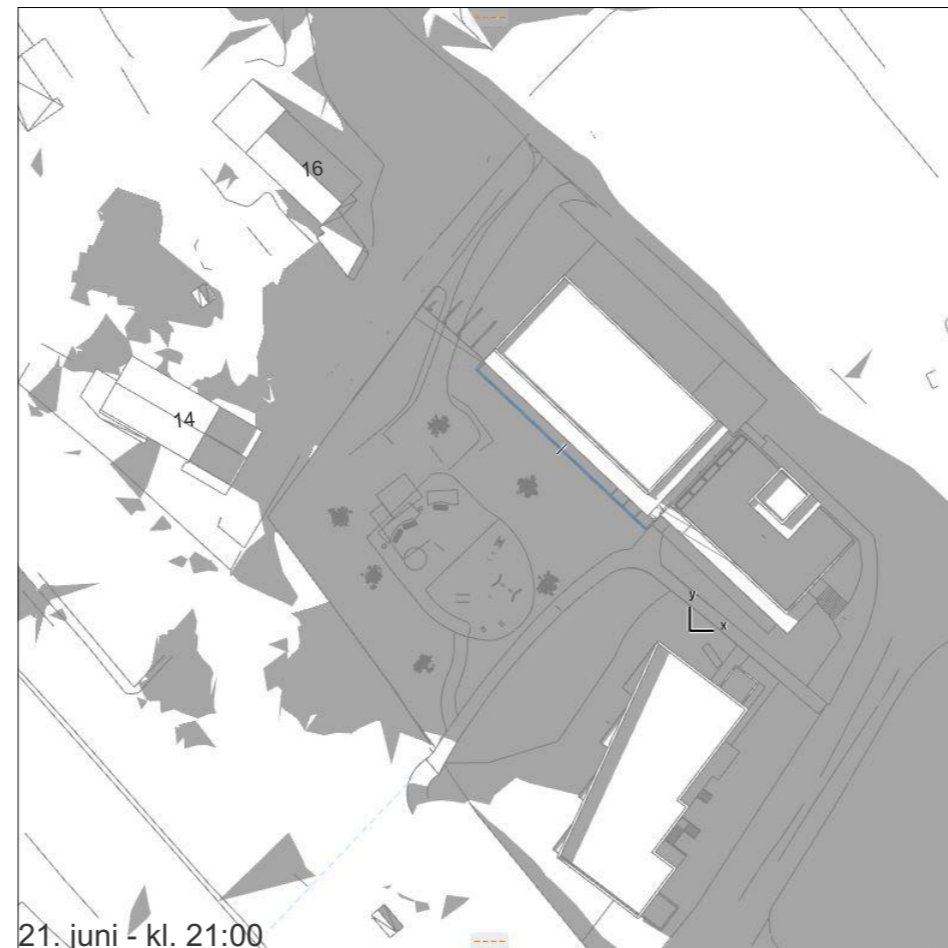
21. juni - kl. 21:00