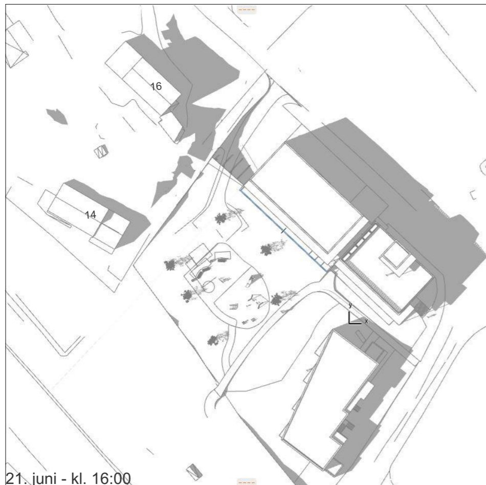
21. juni - kl. 16:00