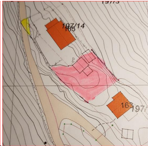
Utsnitt frå situasjonsplanen