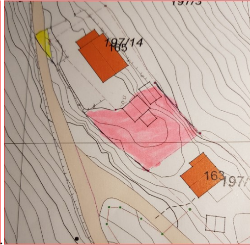
Utsnitt frå situasjonsplanen