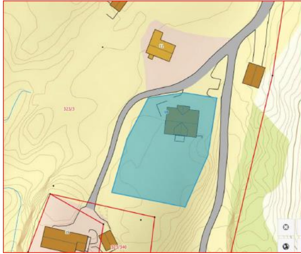
Utsnitt frå situasjonsplanen