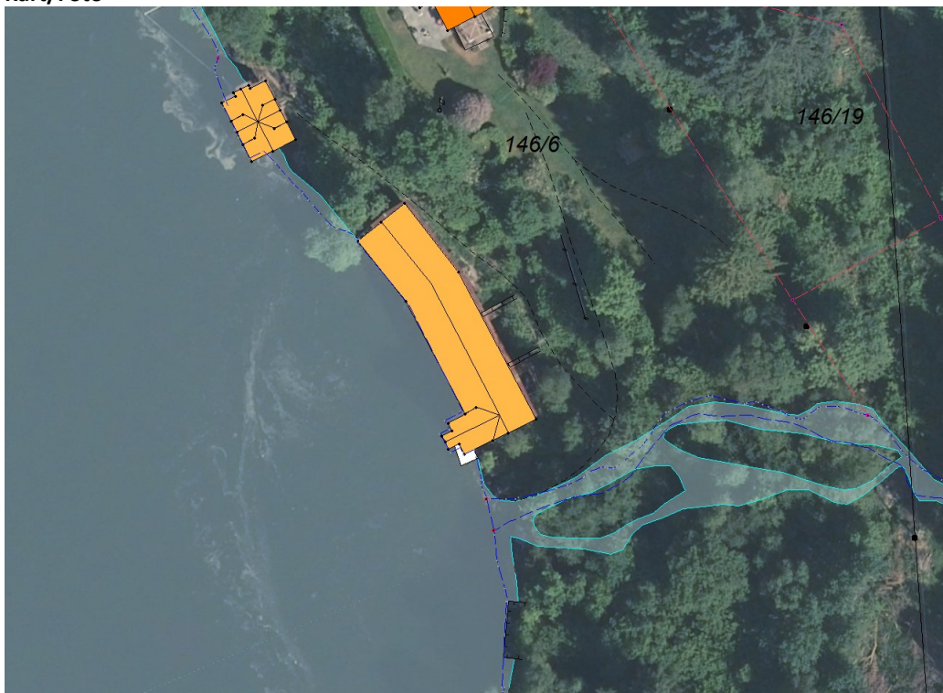
Figur 2 Ortofoto