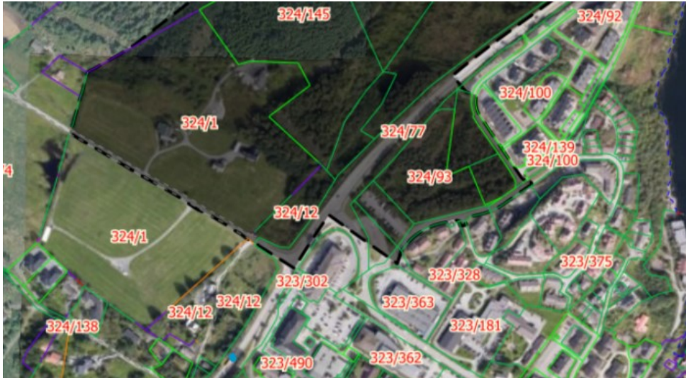
Utsnitt som syner planavgrensinga til områdeplan for Langelandskogen.

Parsellen er sett av til kombinert bebyggelse og anleggsformål i KDP med plankrav. Også denne parsellen ligg innafor plangrensa til områdeplan for Langelandskogen.