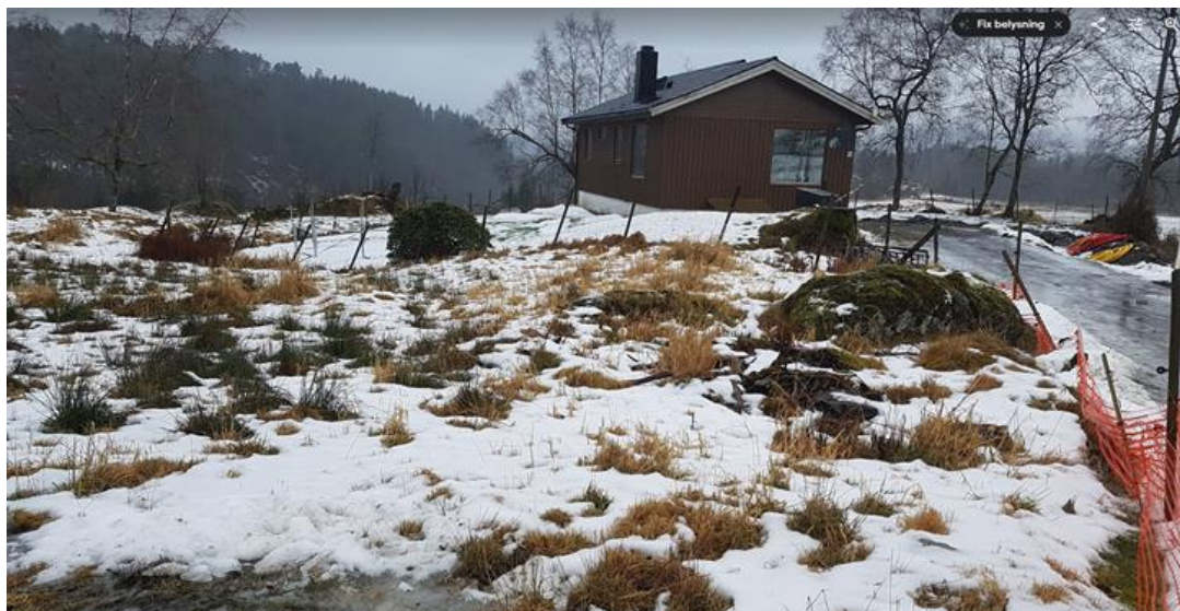
Bilde syner bustadtomt sett frå sør.

Dette tyder at dei mest marginale landbruksareala er vanskeleg å halde i hevd. Områda rundt 207/5 er ei slik kantsone. Det vil ikkje vere til ulempe for landbruksdrifta om noko beite vert lagd til bustadtomta. Utviding av tomta slik eg søkjær om, vil heller ikkje endre bruken av areala rundt. Det vil framleis vere beite. Det vert ikkje skapt nye kantsoner eller restareal som ingen kan nytte. Tilkomst både til landbruksareala og til bustadtomta vert uendra. I og med at huset alt står der vil ein litt større tomt heller ikkje endre kulturlandskapet. Det skal ikkje byggast noko nytt hus på staden og på den måten vert heller ikkje talet på bustadeiningar på staden endra.