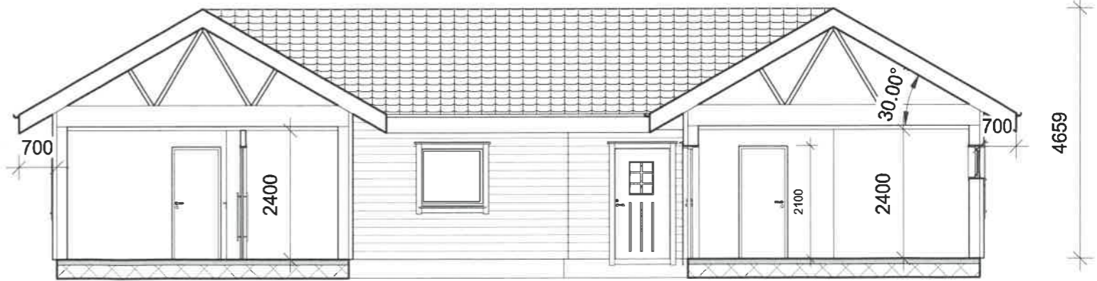
2 Snitt 1 1 : 100