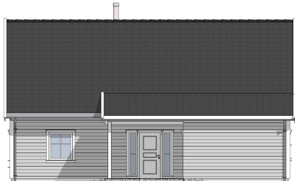
1:100 Fasade 3