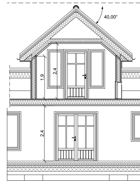
1:100 Snitt C