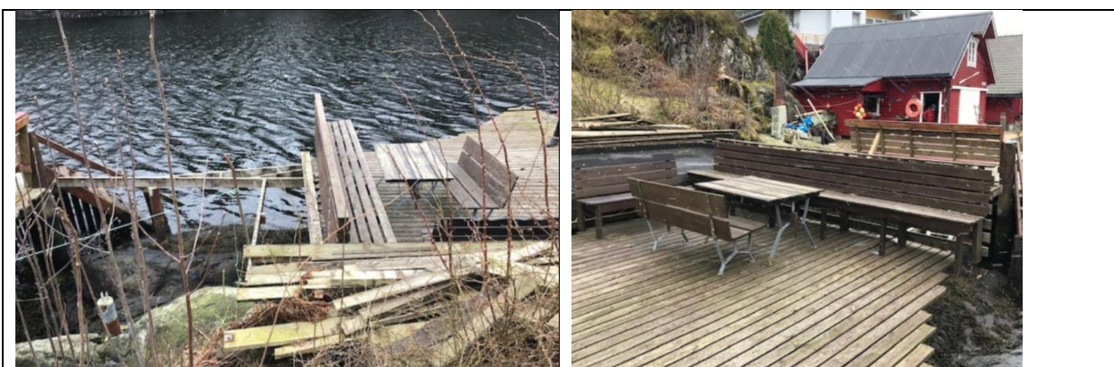
Foto frå synfaring (delar av brygga er fjerna i forhold til flyfoto frå 2000)

Utfrå kartutsnitt ser det ut til at den omtvista konstruksjonen ligg plassert på gbnr 336/112 og delvis over på 336/11. På synfaringa kom det fram at det er uenighet om grenser og rettar til bruk av det aktuelle arealet. Kommunen har ikkje mynde til å vurdere dei privatrettslege tilhøva på staden og vil difor berre ta stilling til om tiltaket er lovleg eller ikkje. Dei privatrettslege spørsmåla som gjeld eigedomsgrense og rett til bruk av det aktuelle arealet på 336/121 tek kommunen ikkje stilling til.