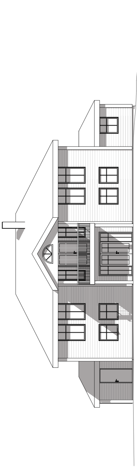
1:100 Fasade Nord