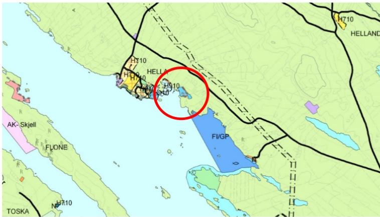
Utsnitt av Kommuneplan for Radøy. Det er vist en rød sirkel rundt Skuthamna.

Ifølge punkt 2.10 er det krav om 1 parkeringsplass pr 4. båt plass for småbåtanlegg.