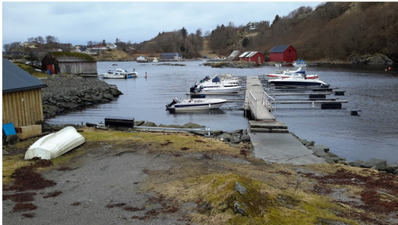
Flytebryggen slik den fremstår i dag.

men ansvarlig søker legger tiltaksklasse 1 til grunn for søknad om flytebrygge. Det er satt x ved omsynssoner under Plangrunnlag i referatet, men ansvarlig søker kan ikke se at det ligger omsynssone over området i Kommuneplankartet.