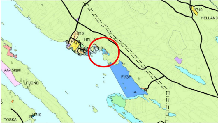
Utsnitt av Kommuneplan for Radøy. Det er vist en rød sirkel rundt Skuthamna.

Ifølge punkt 2.10 er det krav om 1 parkeringsplass pr 4. båt plass for småbåtanlegg.