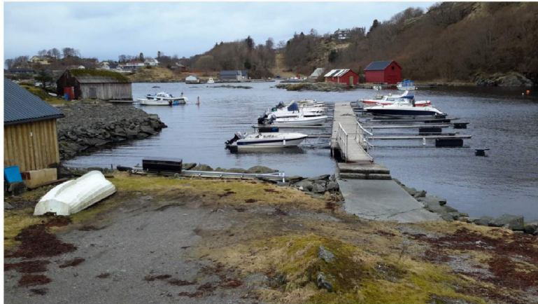
Flytebryggen slik den fremstår i dag.

men ansvarlig søker legger tiltaksklasse 1 til grunn for søknad om flytebrygge. Det er satt x ved omsynssoner under Plangrunnlag i referatet, men ansvarlig søker kan ikke se at det ligger omsynssone over området i Kommuneplankartet.