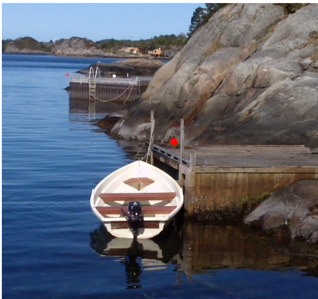
Bilde nr. 2: Det aktuelle området for tiltaket er mellom bryggen i forgrunnen og fjellsiden, fra