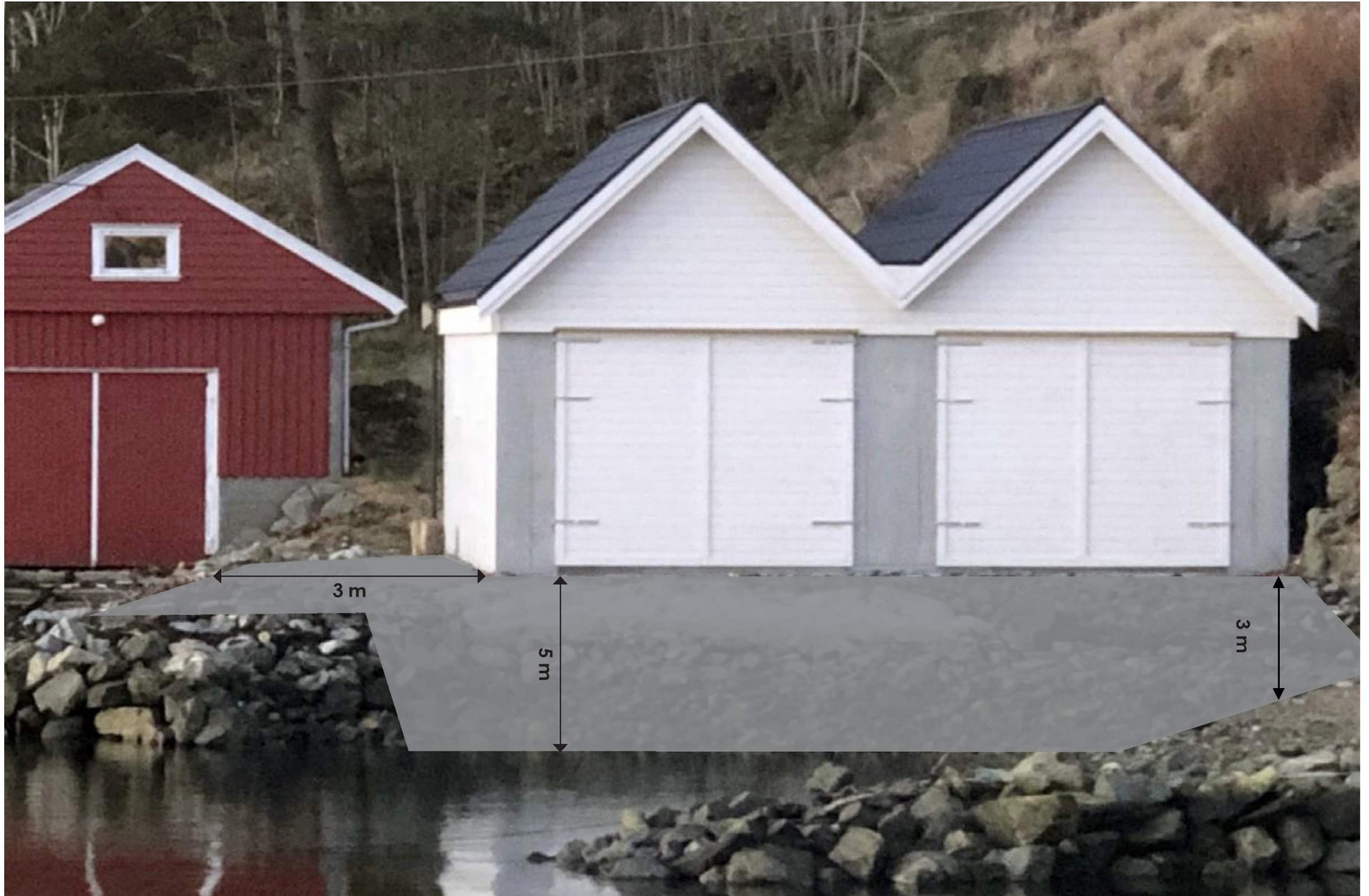
Nøst Dalstø gnr/bnr 19/66 og gnr/bnr 19/68