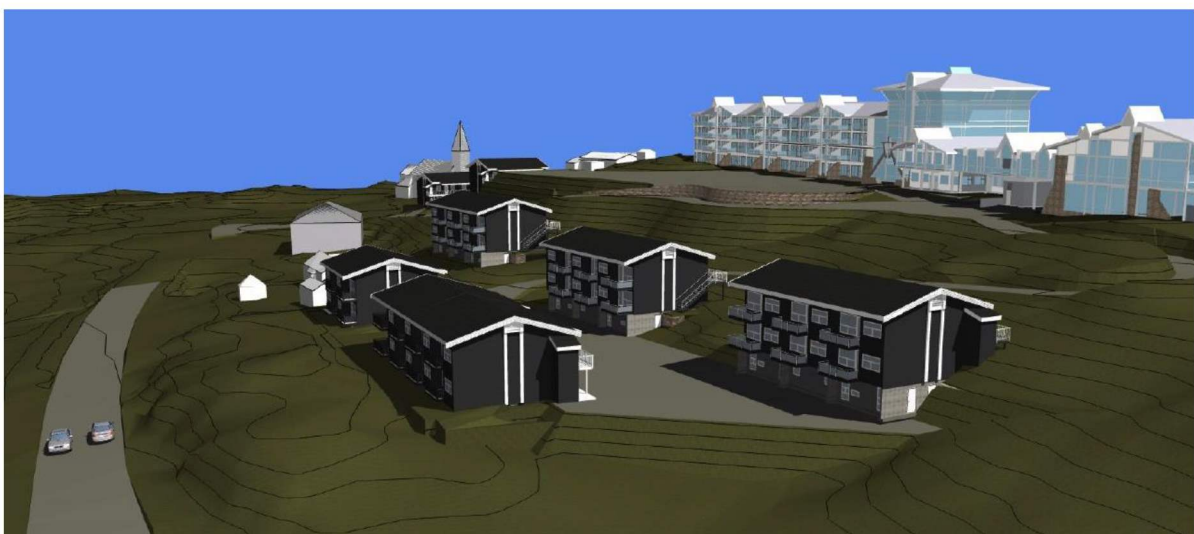
3D illustrasjon av den planlagte utbyggingen sett mot sørøst.