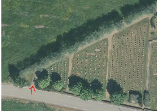
Figur 1: Eksisterande avkjørsel