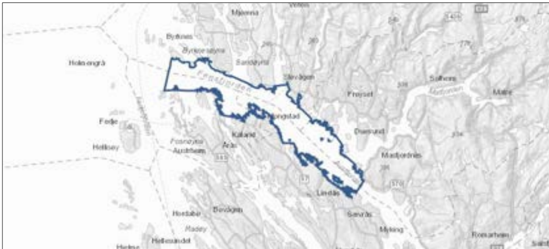
Figur 3 Vannforekomsten Fensfjorden.

Planområdet ligg innanfor vassforekomst Fensfjorden, som er registrert med god økologisk tilstand, og dårleg kjemisk tilstand. Det er i følgje vann-nett registrert dårleg tilstand for nokre stoff i bunn sediment saltvatn, og for kvikksølv i mjukdeler av blåskjel. Det er definert ulike påverknader i vann-nett. Det er registrert liten grad av diffus avrenning og utslepp frå fiskeoppdrett og punktutslepp frå industri, mens det er ukjent påverknadsgrad når det gjeld utslepp frå behandlingsanlegg for farleg avfall.