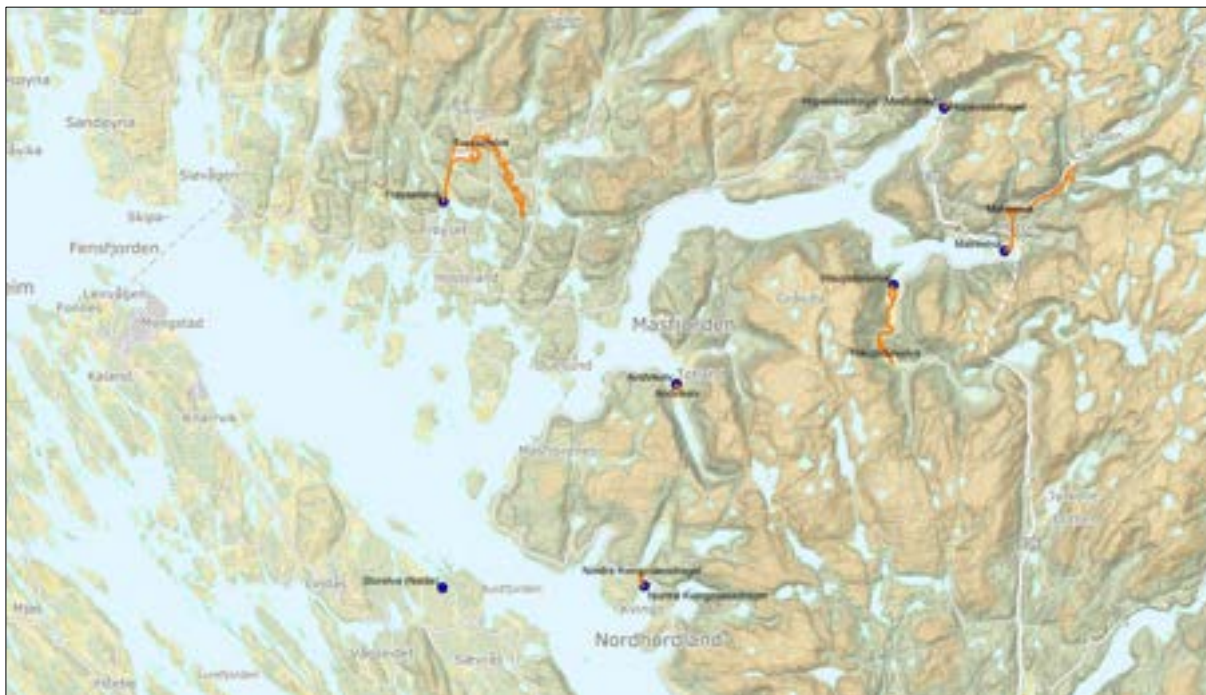
Figur 4 Kart over lakseførande strekningar i fjordsystemet Fensfjorden/Austfjorden/Masfjorden.

Matreelva er undersøkt av LFI-Uni Miljø AS i ei årrekke, og det har vore gode fangstar av aure dei fleste år, med ein snittfangst av aure på 293 fisk i perioden 2010-2019. Gytebestanden til laks er betydeleg mindre enn det som er naudsynt for å nå gytebestandsmålet. I lakseregisteret vert tilstanden til laksebestanden i elva rekna som dårelg/svært dårleg. Det har imidlertid vore ein høgare fangst av laks dei siste åra samanlikna med 1990-talet, med ein snittfangst på 23 laks i perioden 2010-2019 samanlikna med perioden 1990-1999 då det berre vart fanga 2 laks årleg i snitt. Redusert forsuring er truleg årsaka til auka rekruttering av laks i elva.