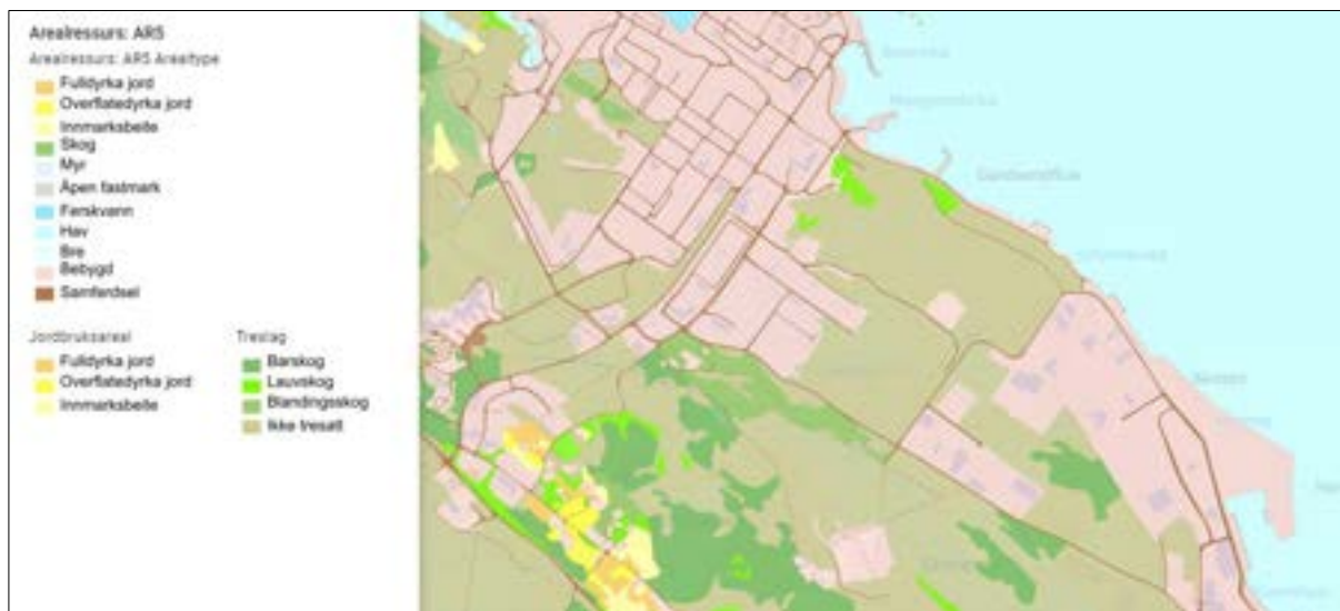
Figur 1 Arealtype AR5.