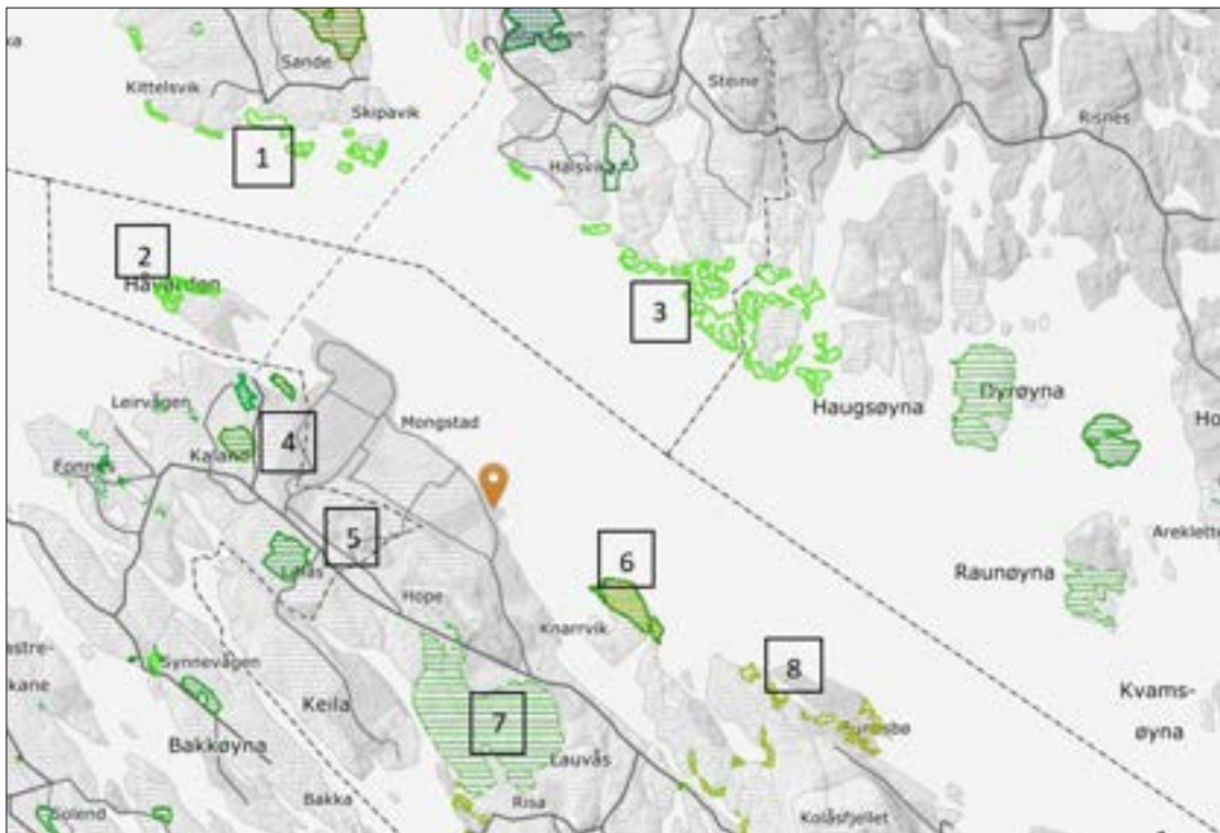
Figur 2 Registrerte naturtyper i nærheten av planområdet. Planområdet er markert med brun pil.