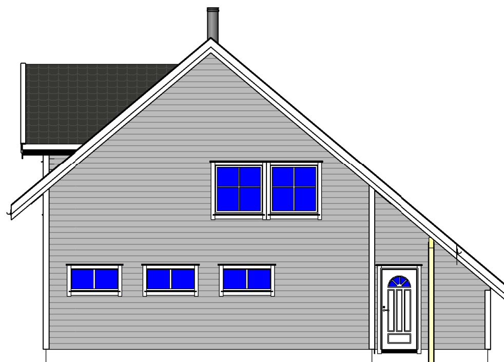
FASADE 2 1 : 100