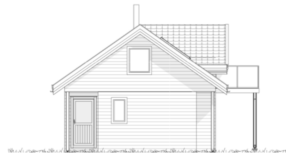
NORD / VEST