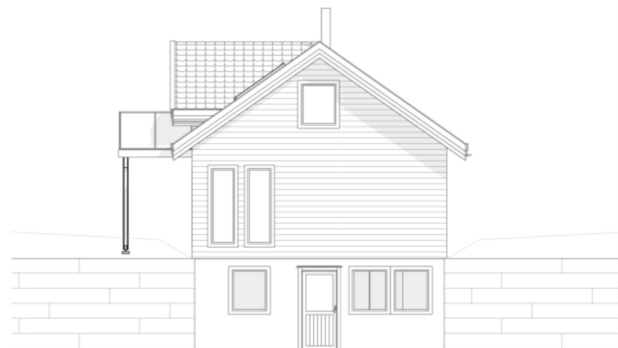
SØR / ØST