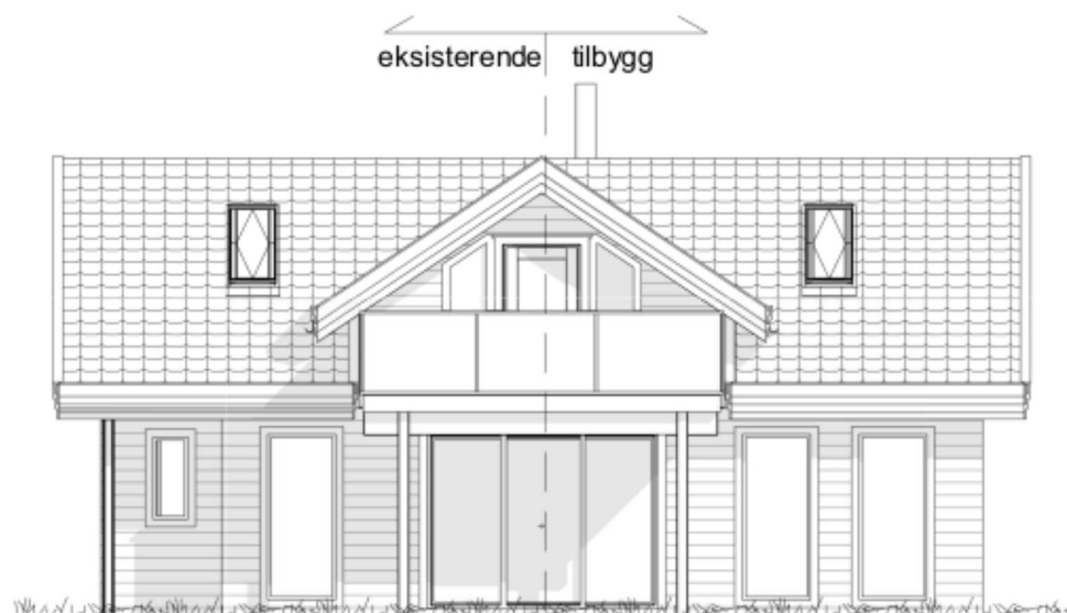
SØR / VEST