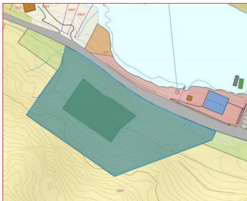
Utsnitt av situasjonsplanen

Plassering av tiltaket er synt i udatert situasjonsplan mottoken 26.03.2021.