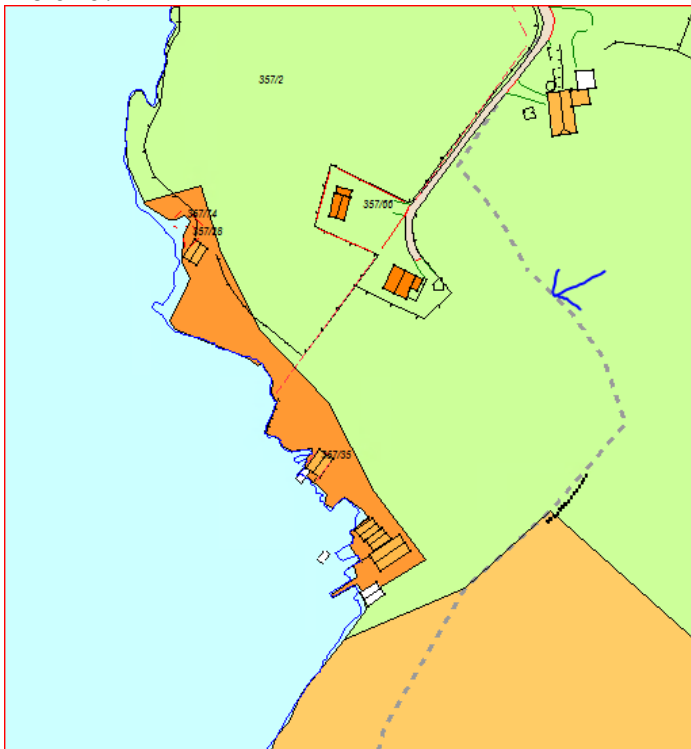
Byggjegrænse mot sjø.

Når det gjeld byggjegrænse mot sjø er det teikna byggjegrænse i arealplankartet til KPA Meland.