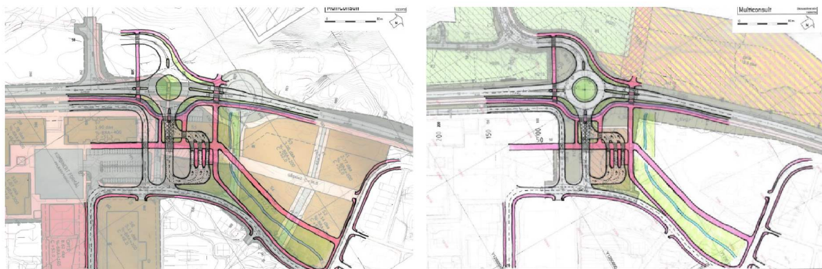
Figur 3. Til venstre: alternativ 1 sett i forhold til gjeldande sentrumsplan for Frekhaug. Til høgre: alternativ 1 sett i forhold til Statens vegvesen sitt forslag for nytt kross på Frekhaug.