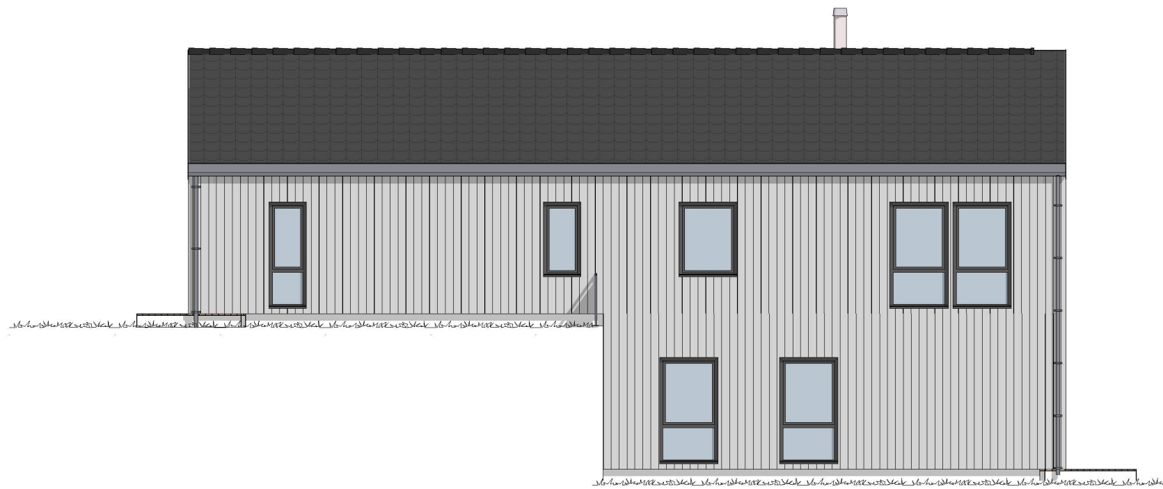
1:100 Fasade 1