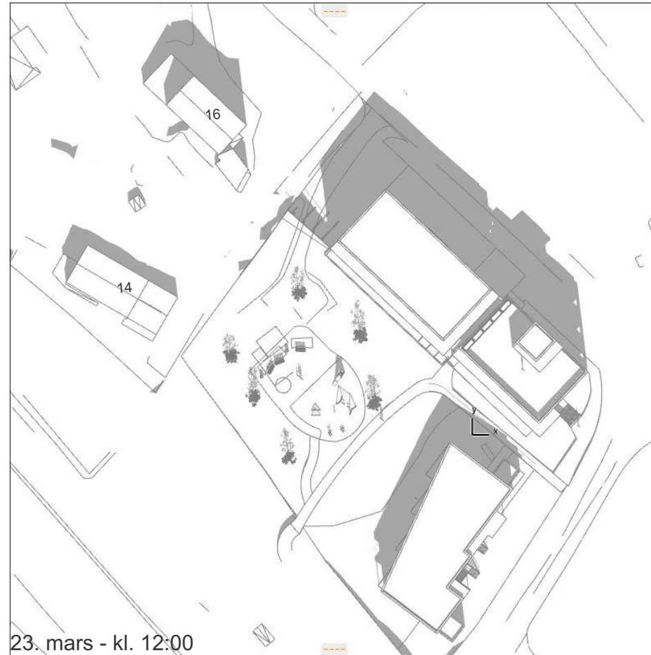
23. mars - kl. 12:00