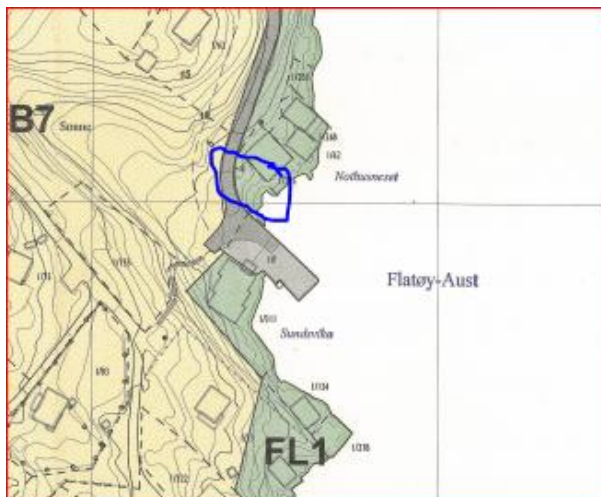
Utsnitt av reguleringsplanen

Det er lagt fram erklæring om rett til parkering og tilkomst samt søkt om utvida bruk av avkøyrsele til kommunal veg i samband med parkeringsplass.