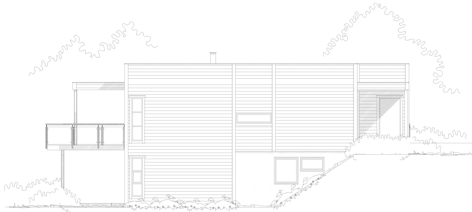
Fasade mot nord-vest

Denne tegningen tilhører Hedalm Anebyhus AS og kan ikke benyttes uten skriftlig samtykke.