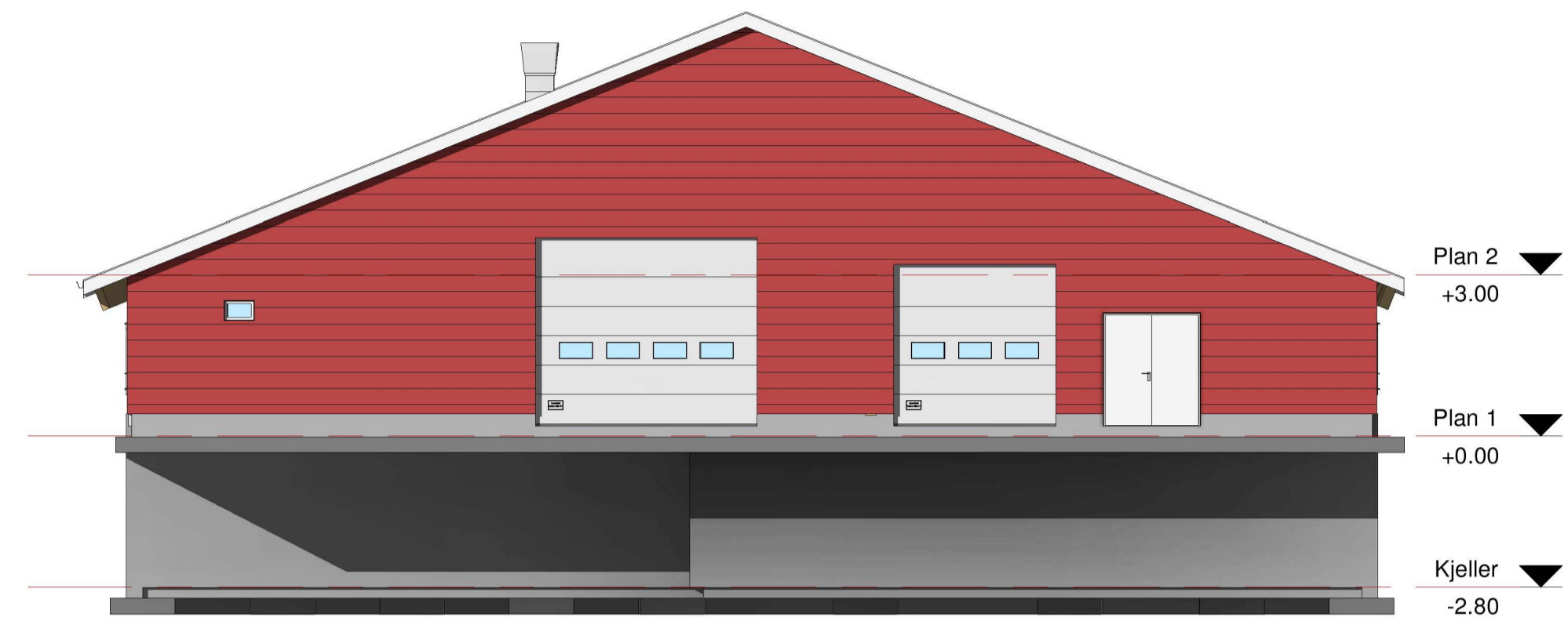
Fasade Vest 1 : 100