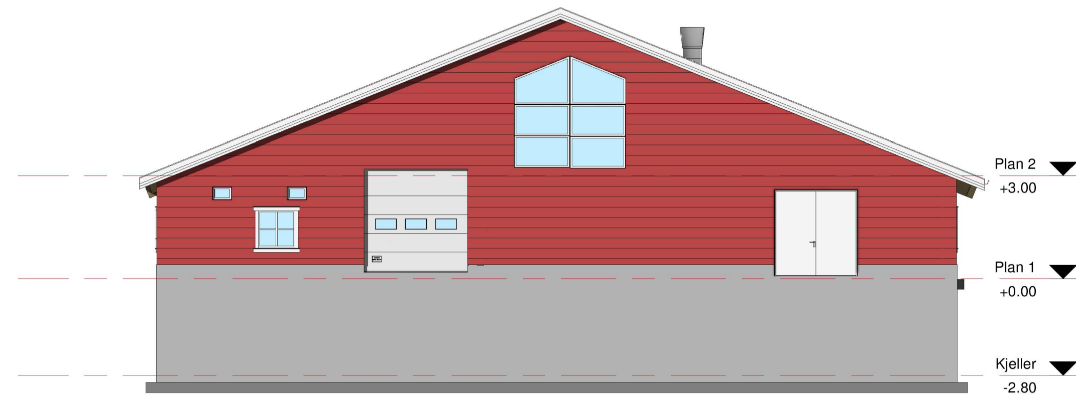
Fasade Øst 1 : 100