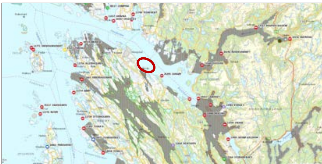
Figur 5 Oversikt over akvakulturlokaliteter og gyteområde/gytefelt i områda kring Mongstad. Planområdet er markert med raud sirkel.

Som ein del av konsesjonssøknadsprosessen vil potensialet for smittespreiing mellom anlegg bli vurdert, mellom anna på bakgrunn av avstandar til andre akvakulturanlegg, samt straummålingar og plassering av avløps- og inntaksleidningar.