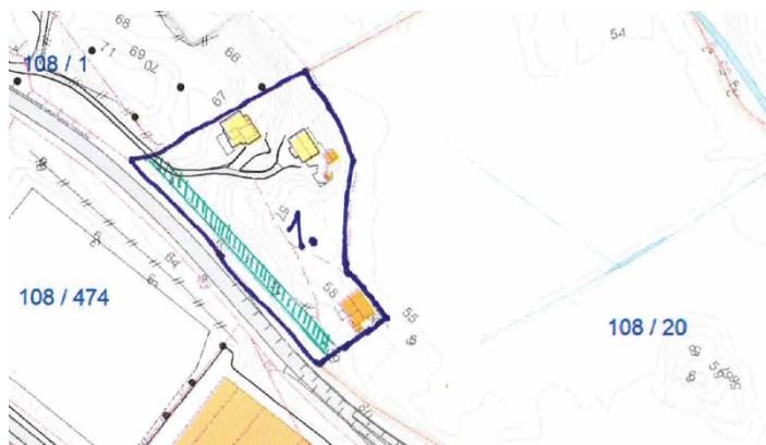
Situasjonskart vedlagt søknaden. Eigedom 1. er omsøkt frådelt, grønn markering viser ny tilkomstveg i grensa mot fv. 57.

Det er søkt om dispensasjon etter plan og bygningslova for frådelling av areal på 7 daa med to påståande våningshus og driftsbygning på gnr. 108 bnr. 20 i Alver kommune. Arealet som skal delast frå er om lag 7 daa. Resteigedomen skal overførast til ny eigar som skal drive arealet saman med ein annan landbrukseigedom.