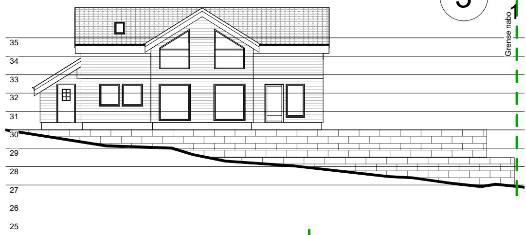
3 Mur mot veien 1 : 200