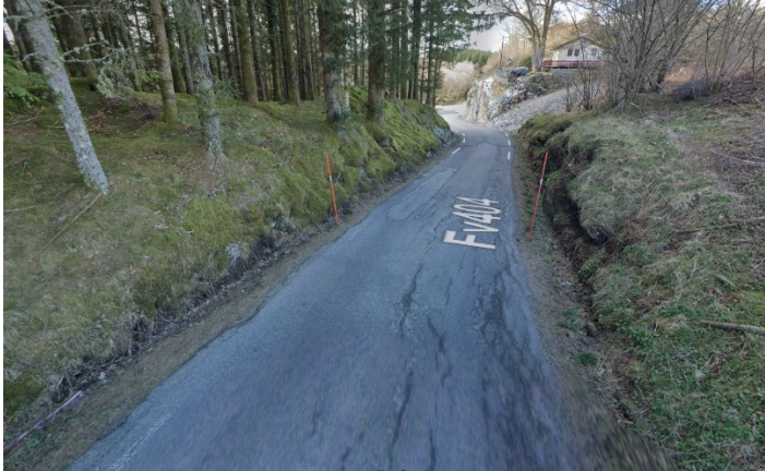
Bildet over: Viser overgangen fra gammel til ny veg