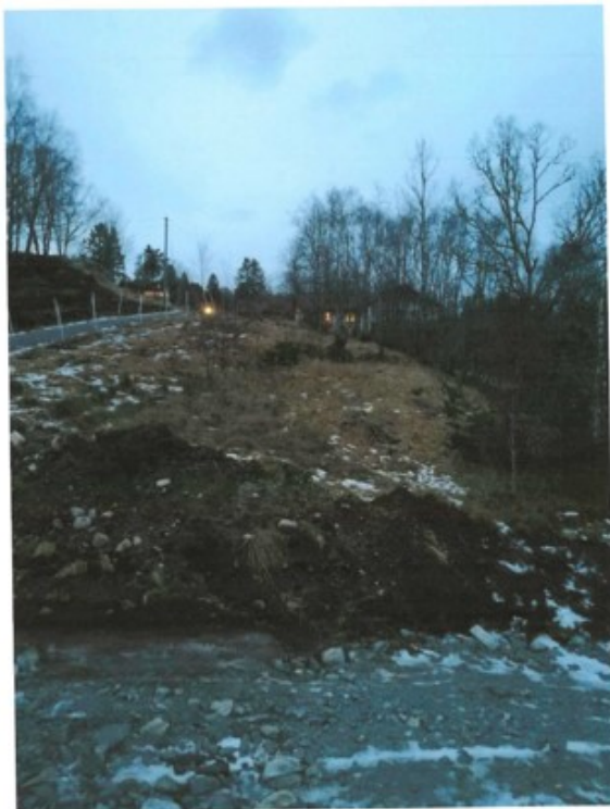
Dele bilde er tatt fra plabingen vår og viser "beite" marken hennes. Denne marken har vært brukt til lufing av vester den har ingen ting å beite på her.