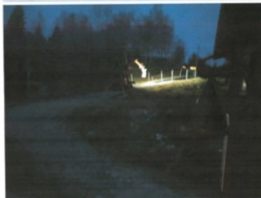
Her er beiset på at veien er tatt i bruk.

Billete sendt inn frå tiltakshavar som viser den del av landbruksvegen som går forbi klagars eigedom gbnr. 193/9.