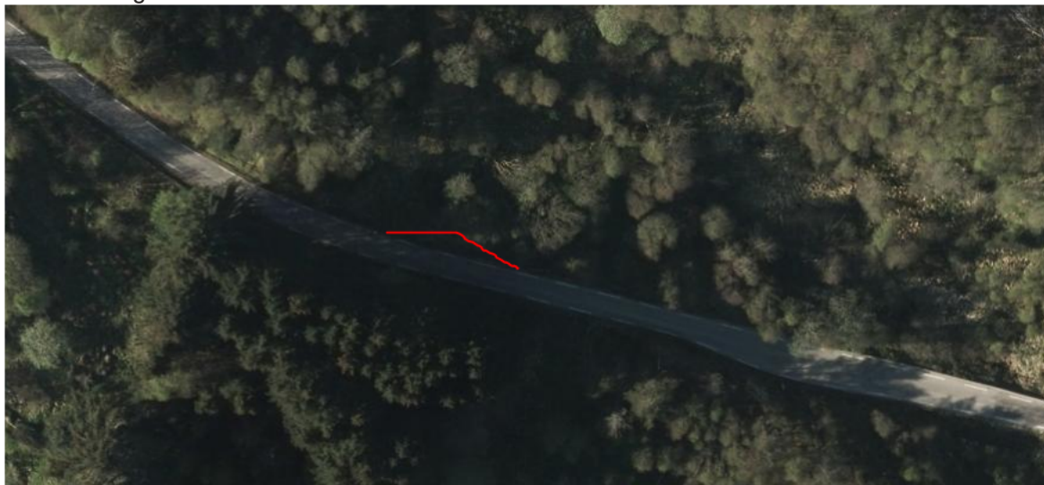
Rød markering viser hvor utbedringen i ettertid er utført.