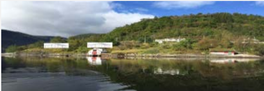
Eksisterande situasjon i området og «plassering» av dei planlagte fritidsbustadane.

Arealet innan for planområde er i delvis utbygd, men føremålet med reguleringa er meir å leggje til rette for vidare drift og bruk. Verknaden av dei planlagte tiltak i høve til dagens situasjon er slik sett mindre. Det er ikkje urørt område og ein finn eksisterande tiltak frå sjø og opp til veggen.