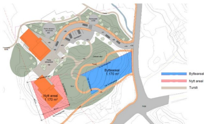
Skisse over alternativ A2

A2 speilvender formålgrensa i KDP og spissen ned mot postvegen kjem i dette forslaget på vestsida av kollen. Området i seg sjølv vert ikkje større, men om lag 1, 2 daa er i strid med formålgrensa i KDP.