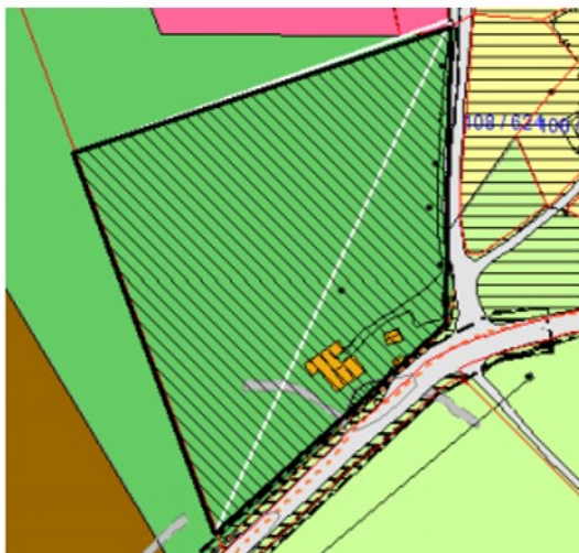
Opprinnelig innspel til KDP