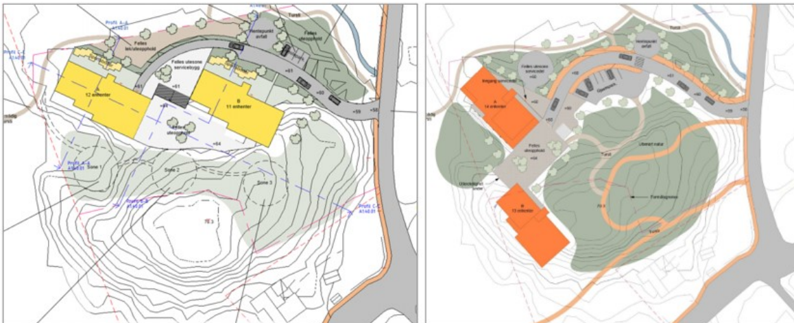
Alternativ A1- bygningsmassen i tråd med KDP

Det er i planinitiativet lagt fram to ulike forslag til utbygging- eit forslag som ligg i tråd med gjeldande formålsgrensa i KDP og eit som føreset ei justering av formålsflata for B1.