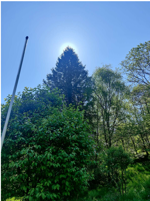
Bilde 2 Høyvokst skog

Det er også høyvokst skog like ved nåværende plattung (se bilde 2 under), som tar det meste av solen fra midt på dagen. Da vi verken kan eller ønsker å gjøre noe med skogen, så er det svært gunstig for oss å kunne bevege seg dit solen skinner. :)