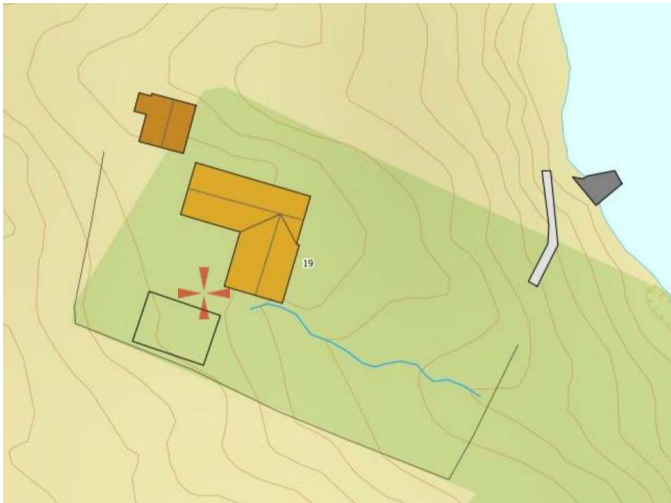
Bilde 4 Kart viser nåværende brygge

Bryggen vil ligge der den nåværende er tegnet på kartet: