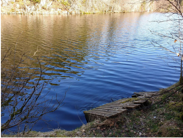
Bilde 3 Nåværende brygge ligger under vann

Må renoveres da den er råttent og ligger delvis under vann. Vi ønsker i den sammenheng å gjøre den om til flytebrygge som ligger på langs mot land på 5 x 3 meter. Flytebrygge ønsker vi for å sikre bryggen i forbindelse med store endringer i vannstand når det nye vannbehandlingsanlegget, som skal forsynes 100% fra Storavatnet, tas i bruk. Nåværende løsning vil da ikke være egnet.