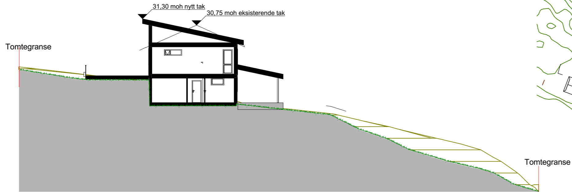
1:200 Terrengprofil B