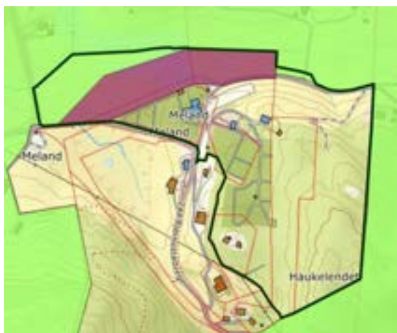
Figur 4 Kartutsnitt som viser kommuneplanen sin arealdel. Forslag til plangrense er vist med svart strek.

I Meland kommune sin arealdel til kommuneplanen 2015 - 2026 er den del av planområdet som ikkje inngår i gjeldande reguleringsplan avsett til framtidig grav- og urnelund og LNF-område. Langs bekken i nord er det avsett omsynssone bevaring naturmiljø.