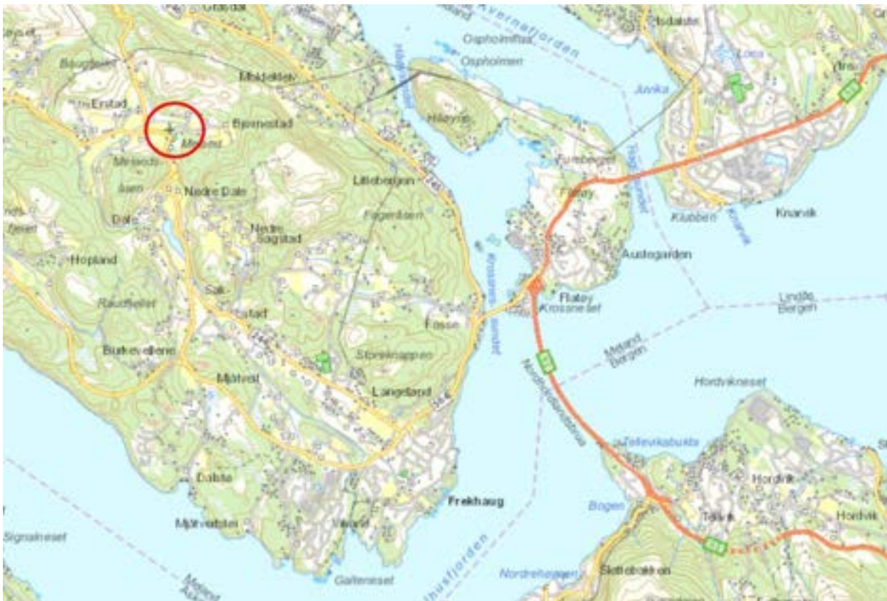
Figur 1 Oversiktskart som viser lokalisering av planområdet

Med heimel i §§ 12-8 og 12-14 i plan- og bygningslova blir det med dette varsla om oppstart av reguleringsplanarbeid for utviding av Meland gravplass. Forslagstiller er Meland kommune, med Asplan Viak AS som utførande plankonsulent.