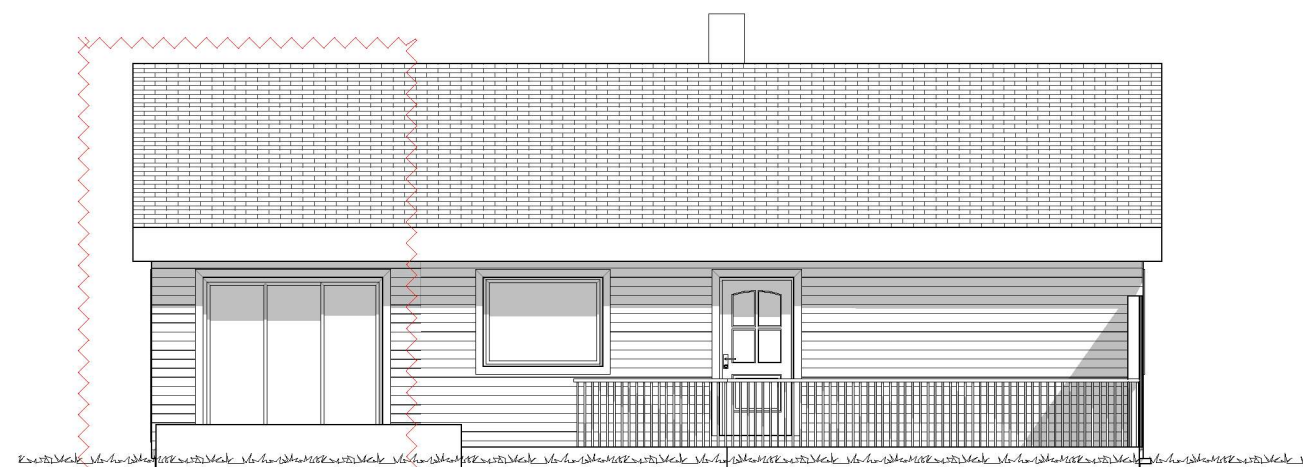
1:100 Fasade Sør-Vest RevA

BRA eksisterende bolig 130m 2 + tilbygg 57m 2 = 122m 2