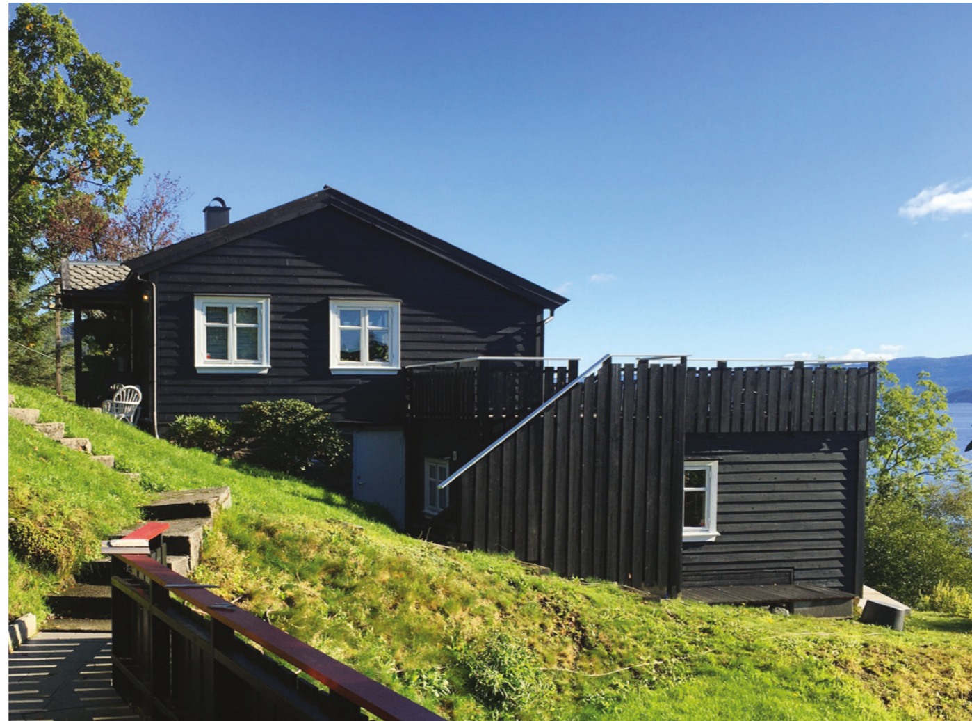
FLATØYVEGEN 226 - DAGENS FASADE MOT SØRVEST