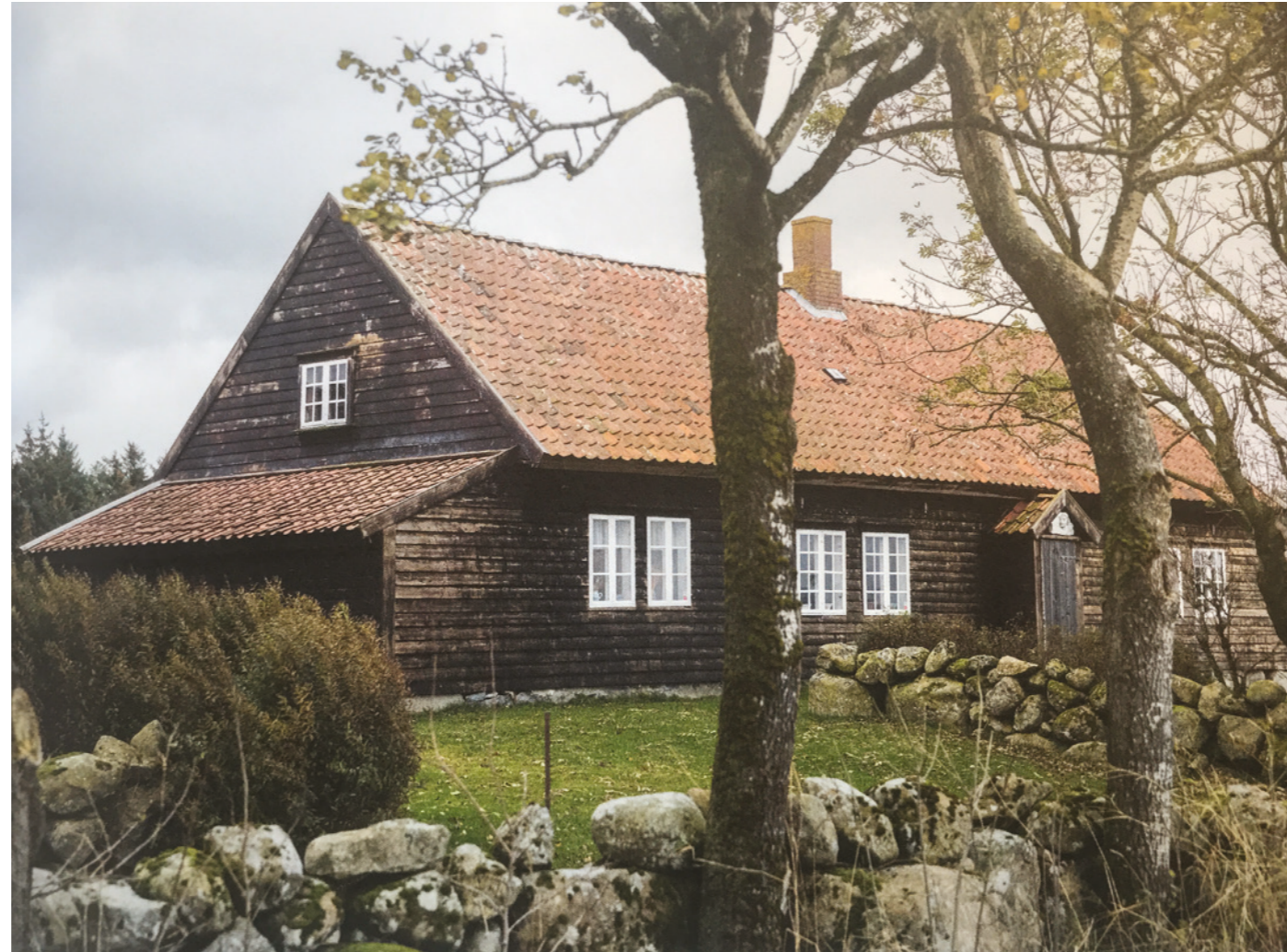
JÆRHUS - TORHUSET

Bilde over viser Torhuset med svart fasade og hvite vinduskarmer.