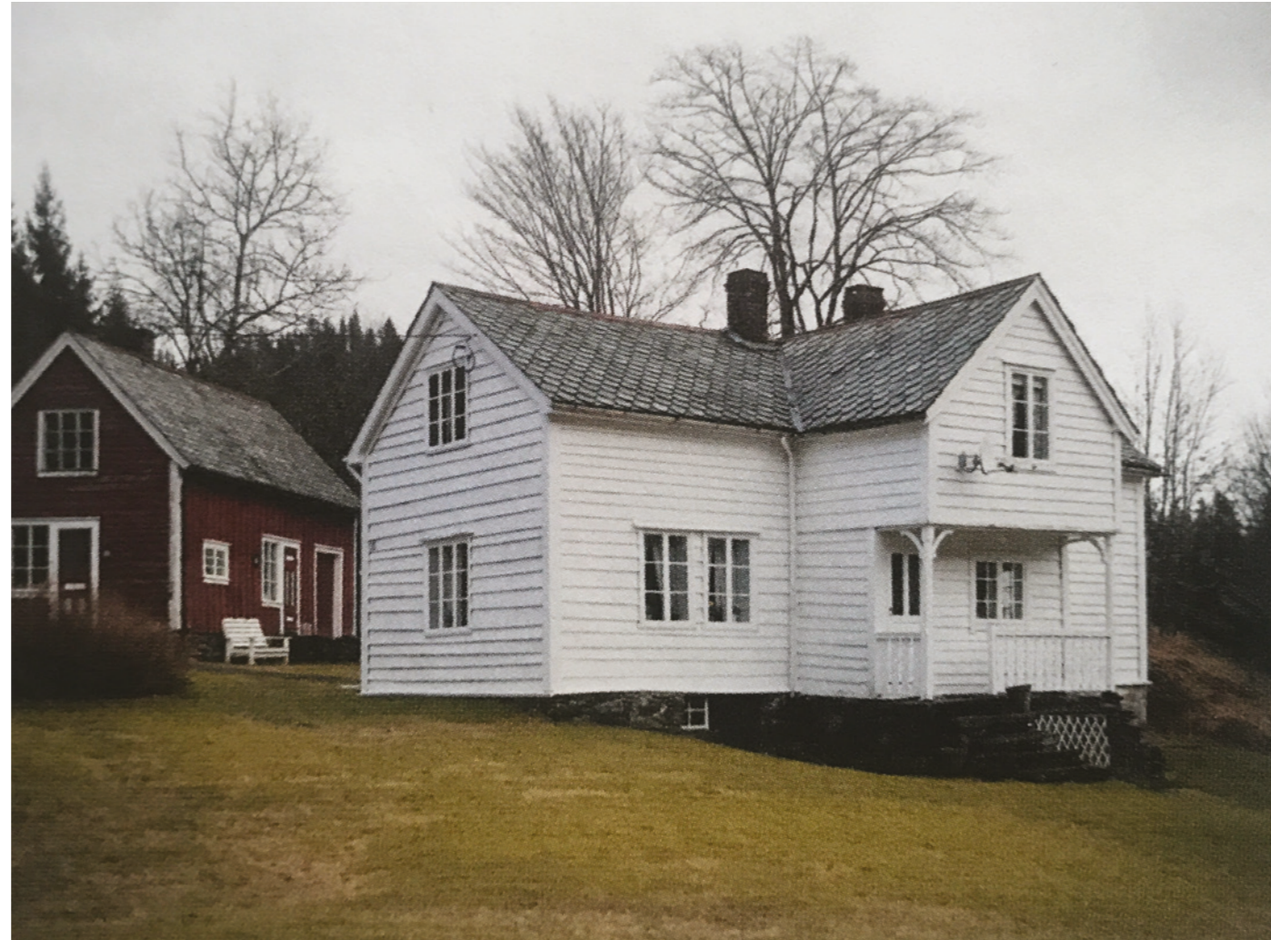
HAUGE - FJALER En tverrgående takark over en smalere utbygging