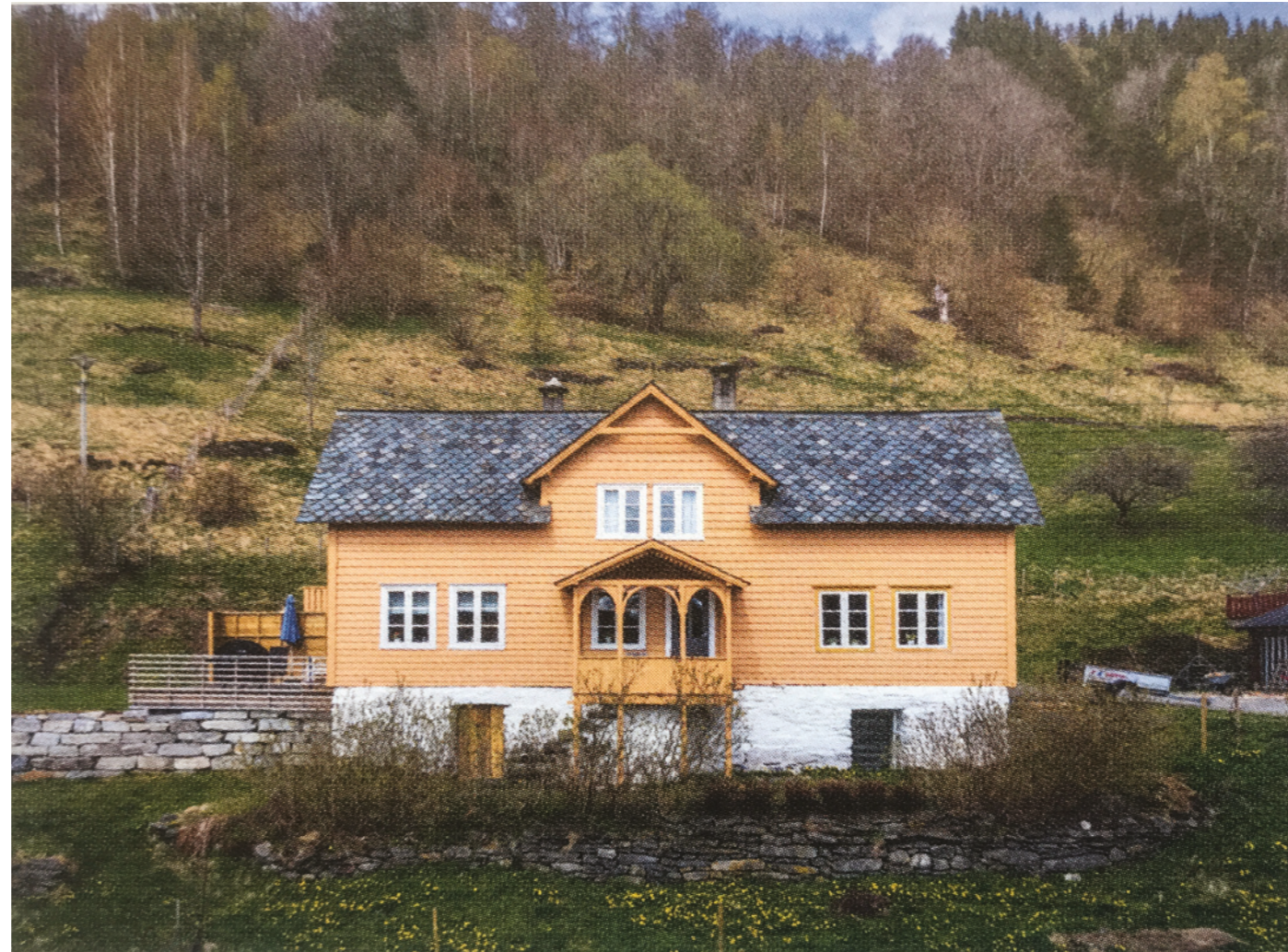
HAKASTAD - ULVIK

En tverrgående takark og en hvit pusset sokkel.