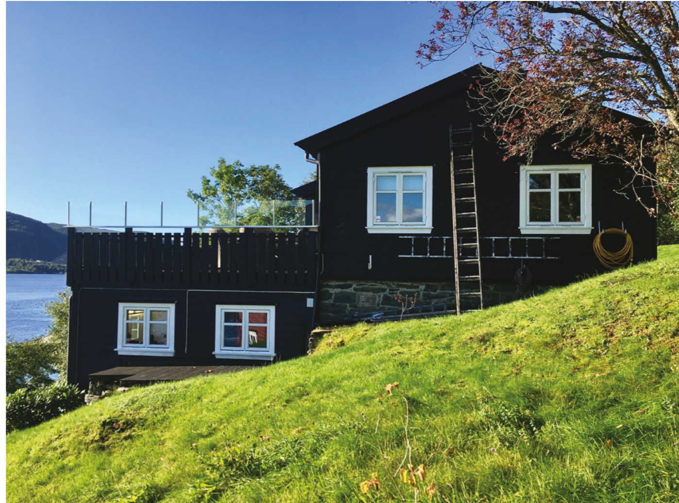
FLATØYVEGEN 226 - DAGENS FASADE MOT NORDØST