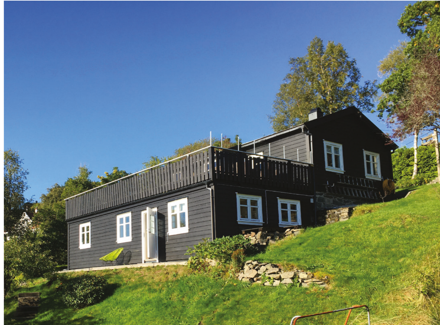
FLATØYVEGEN 226 - DAGENS BYGGNING FRA ØST

Kjelleretasjen og gjerdet rundt terrassen er i samme materiale som hovedbygningen Samlet gir dette et inntrykk av at bygningen har et større volum enn den faktisk har.