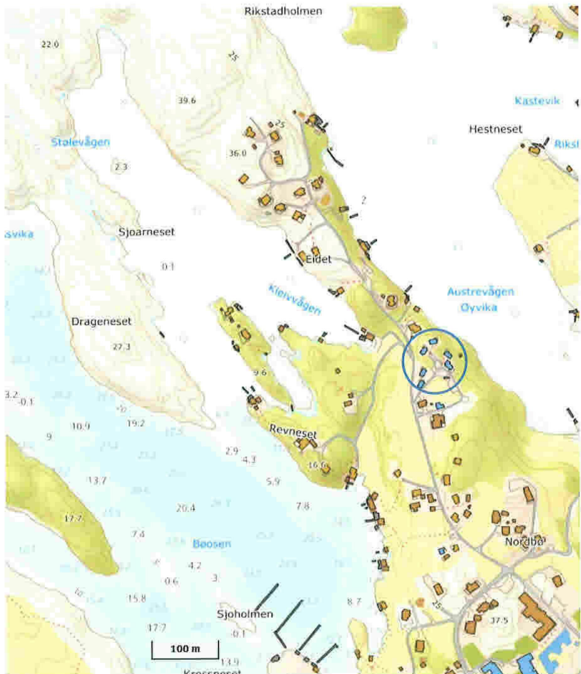
Blå ring : Nordbø Hyttetun

Det vert i denne omgang søkt om rammeløyve til deling i samsvar med delingsplan.