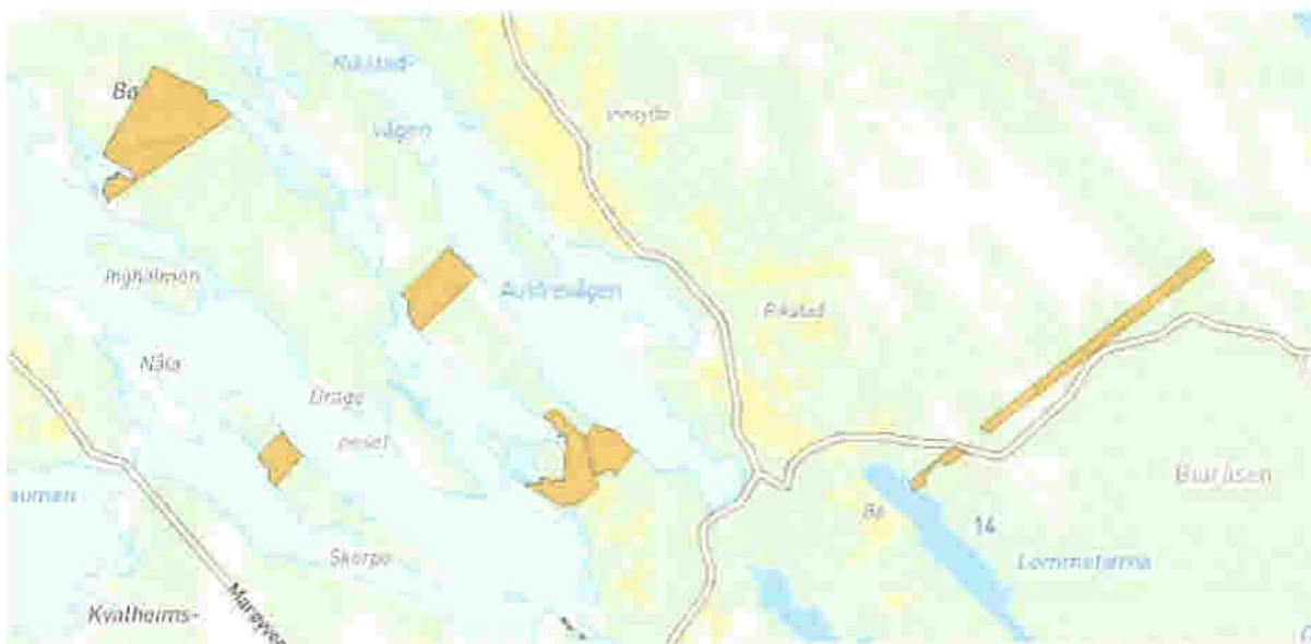
Gbnr. 4631/424/13 (Norkart, e-torget)