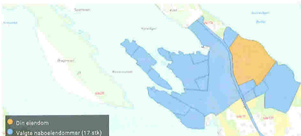
Gjeldande parsell og varsla naboar (Norkart, e-torget)